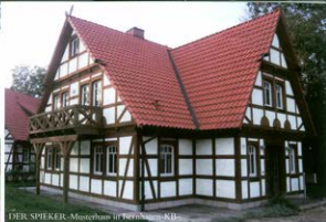
DER SPIEKER - Musterhaus in Isernhagen-KB