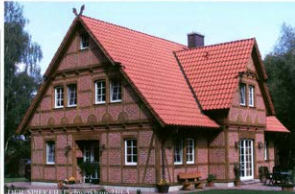
DER SPIEKER - Fachwerkhaus 2003 A