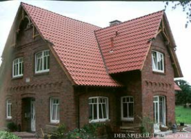
DER SPIEKER - Musterhaus 1001