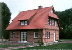
DER SPIEKER - Probewohnhaus in Neustadt-Schneeren