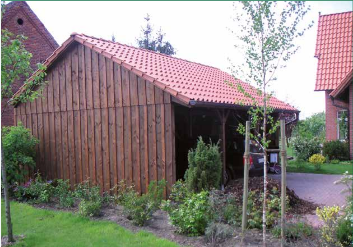
DER SPIEKER-Nebengebäude BDS-C2