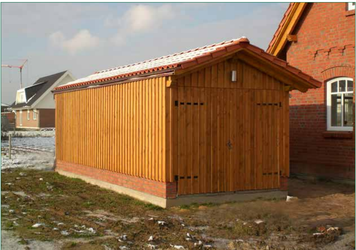
DER SPIEKER-Nebengebäude BDS-G1