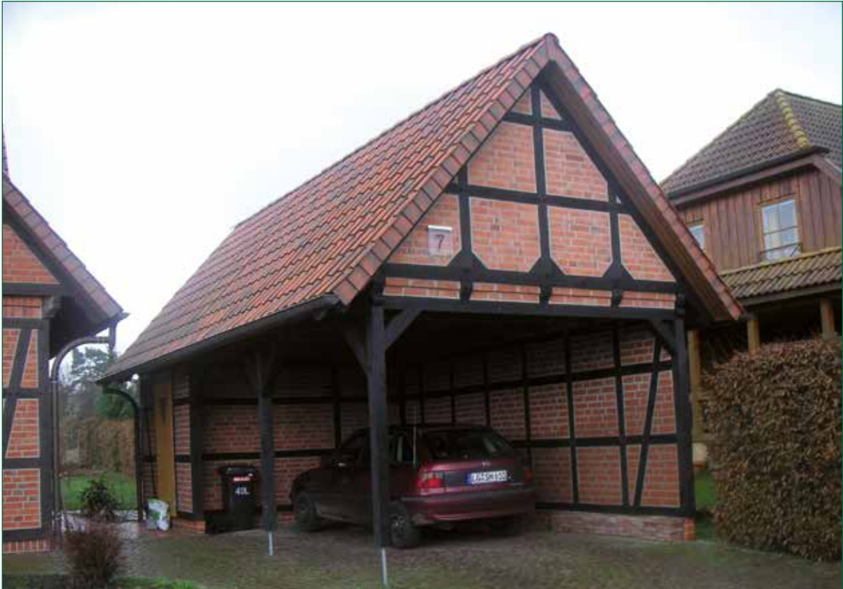
DER SPIEKER-Nebengebäude FW-C1