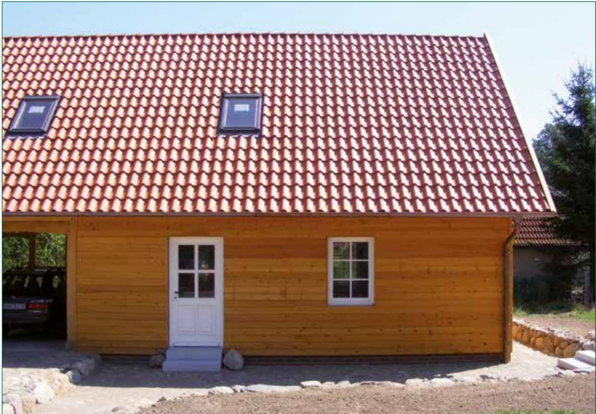
DER SPIEKER-Nebengebäude BDS-G5