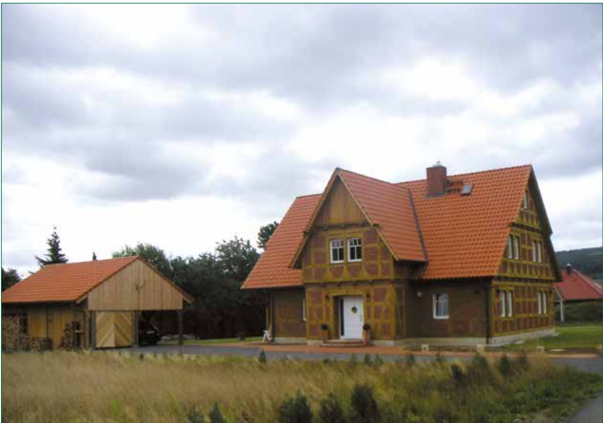
DER SPIEKER-Nebengebäude BDS-C3