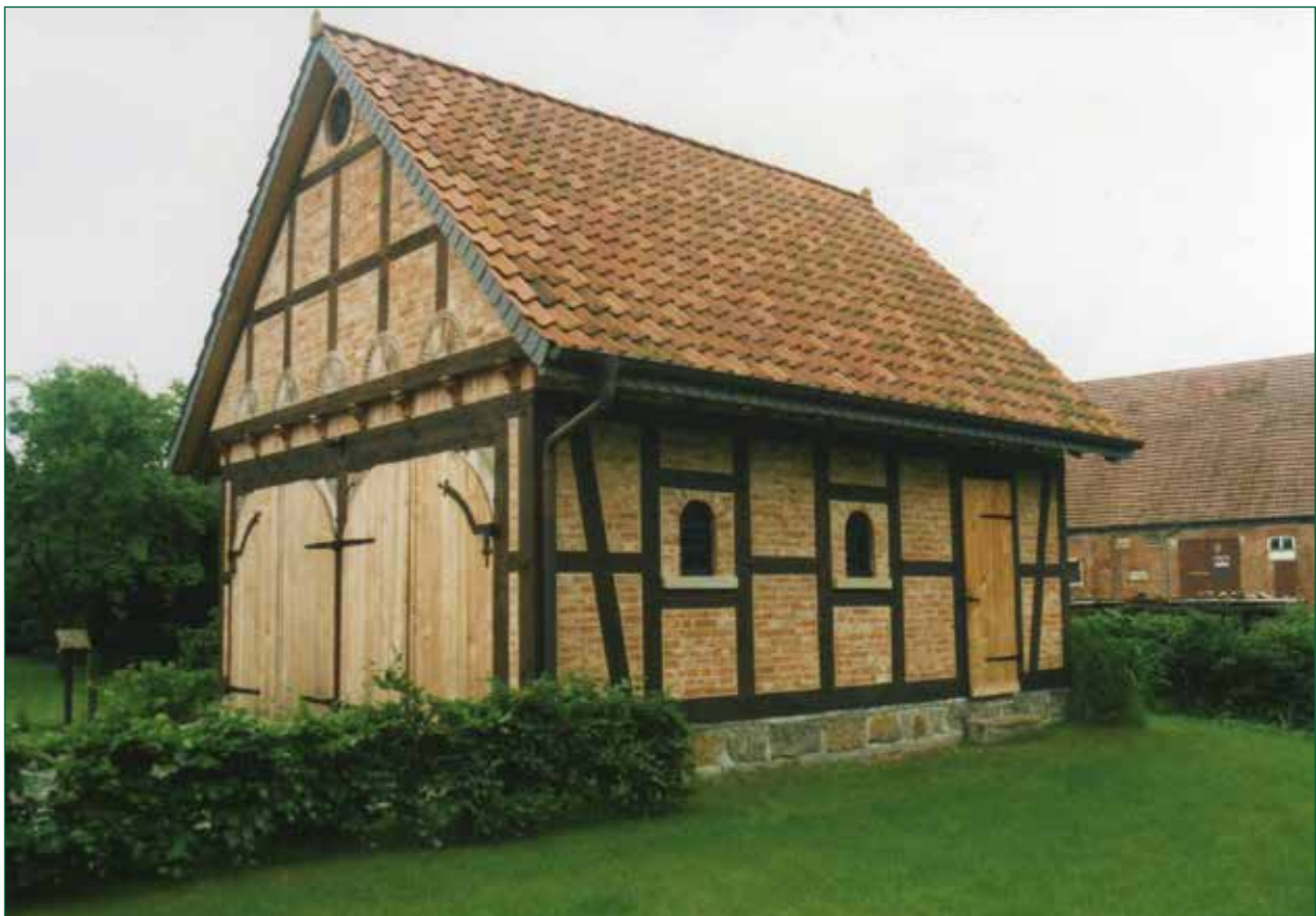
DER SPIEKER-Nebengebäude FW-G9