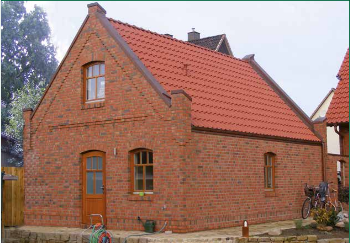
DER SPIEKER-Nebengebäude BS-G4