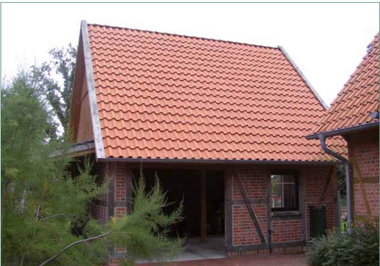
DER SPIEKER-Nebengebäude FW-G5