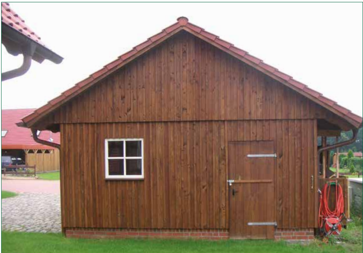
DER SPIEKER-Nebengebäude BDS-C1