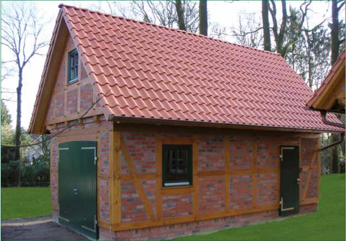
DER SPIEKER-Nebengebäude FW-G1