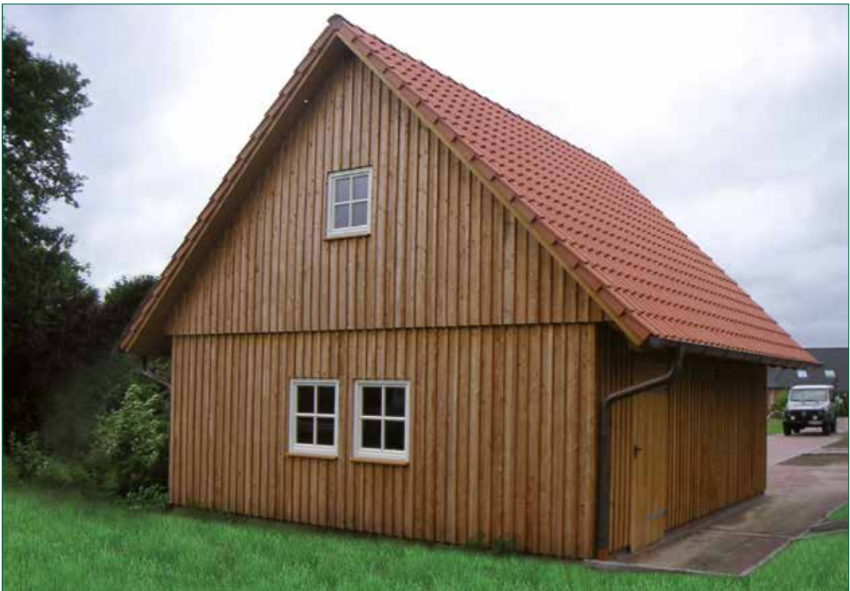
DER SPIEKER-Nebengebäude BDS-G3