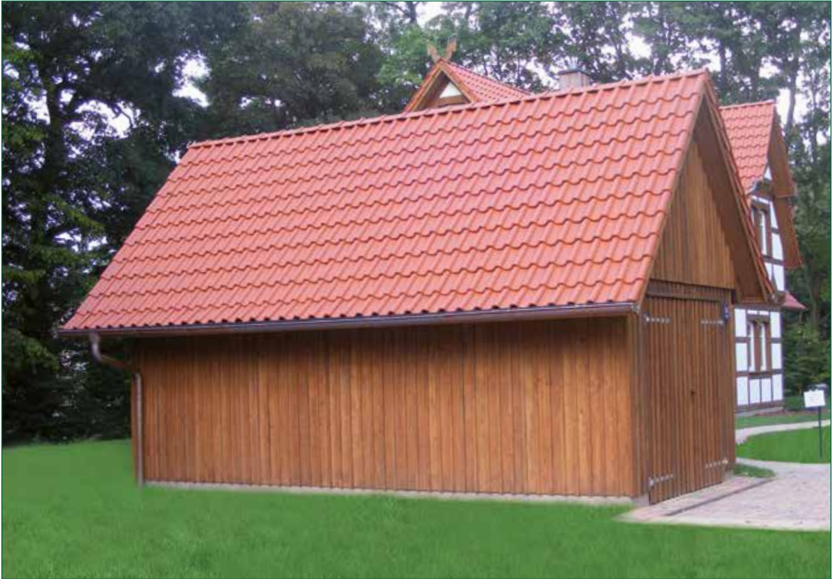
DER SPIEKER-Nebengebäude BDS-G2