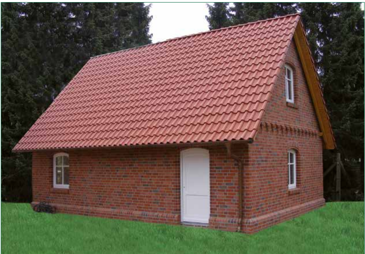
DER SPIEKER-Nebengebäude BS-G5