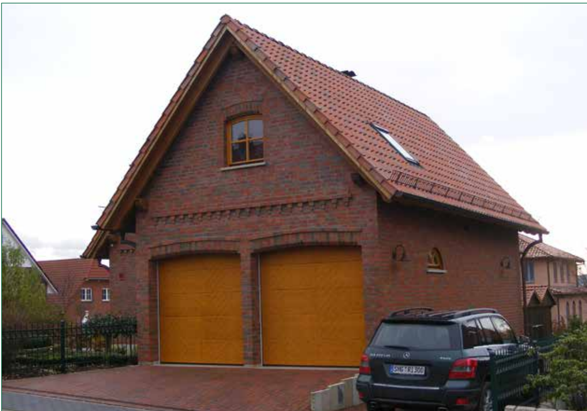
DER SPIEKER-Nebengebäude BS-G3