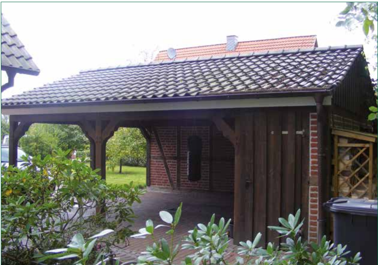
DER SPIEKER-Nebengebäude FW-C2