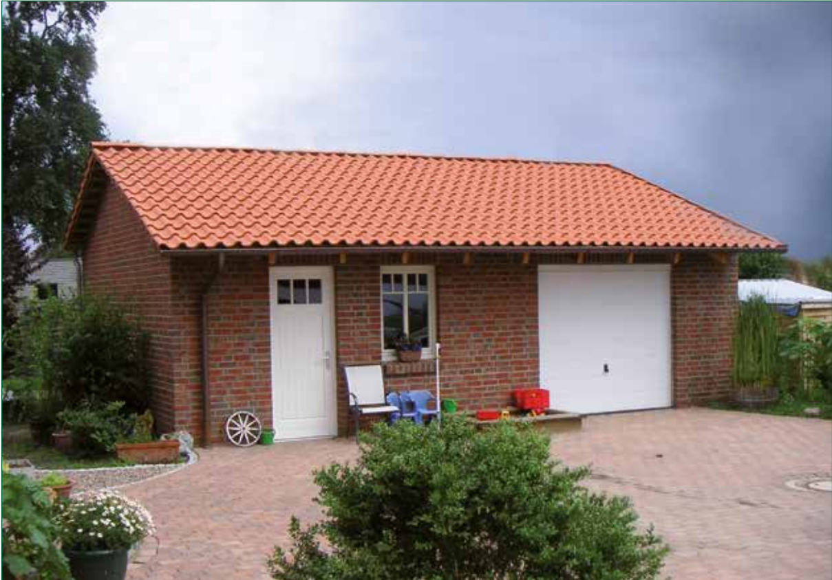
DER SPIEKER-Nebengebäude BS-G2