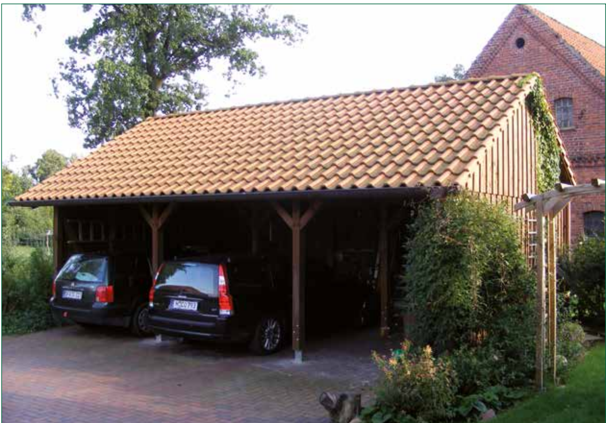
DER SPIEKER-Nebengebäude BDS-C2