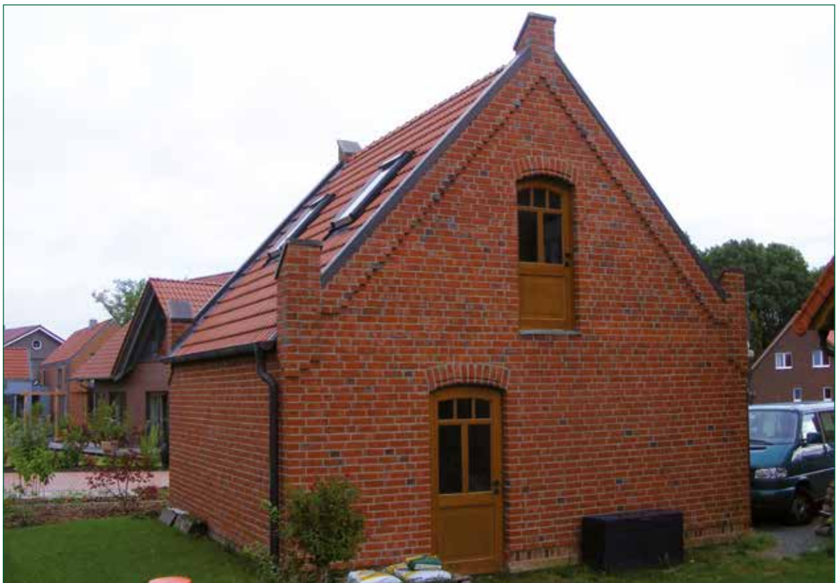
DER SPIEKER-Nebengebäude BS-G3