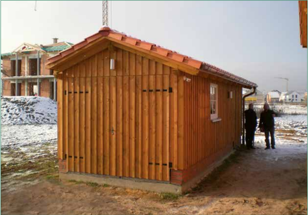
DER SPIEKER-Nebengebäude BDS-G1