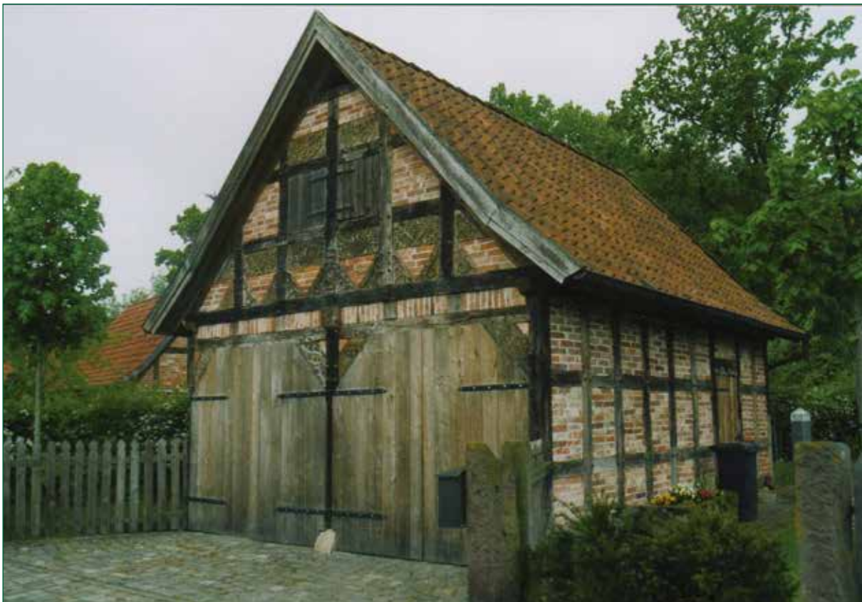
DER SPIEKER-Nebengebäude FW-G7