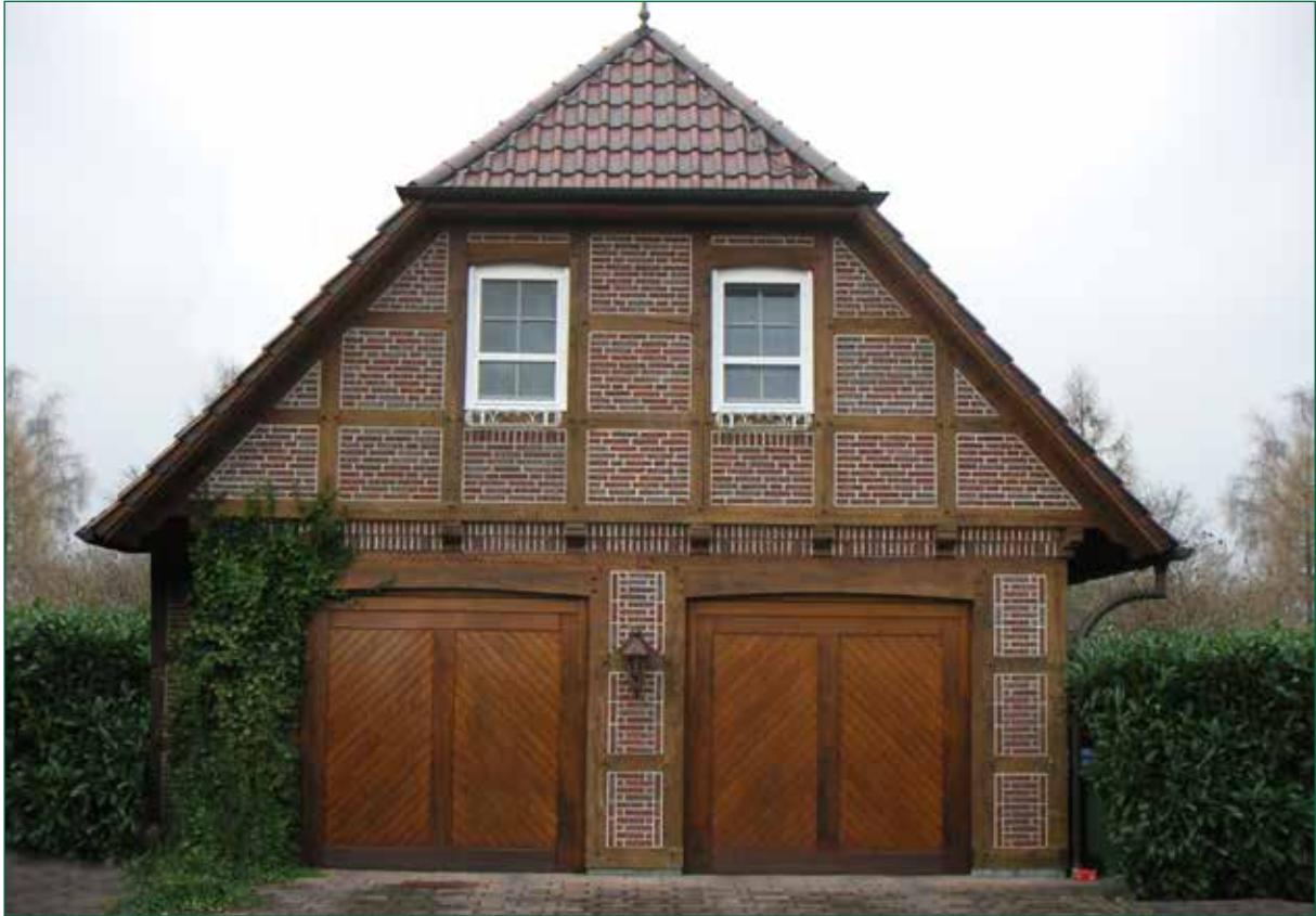
DER SPIEKER-Nebengebäude FW-G8