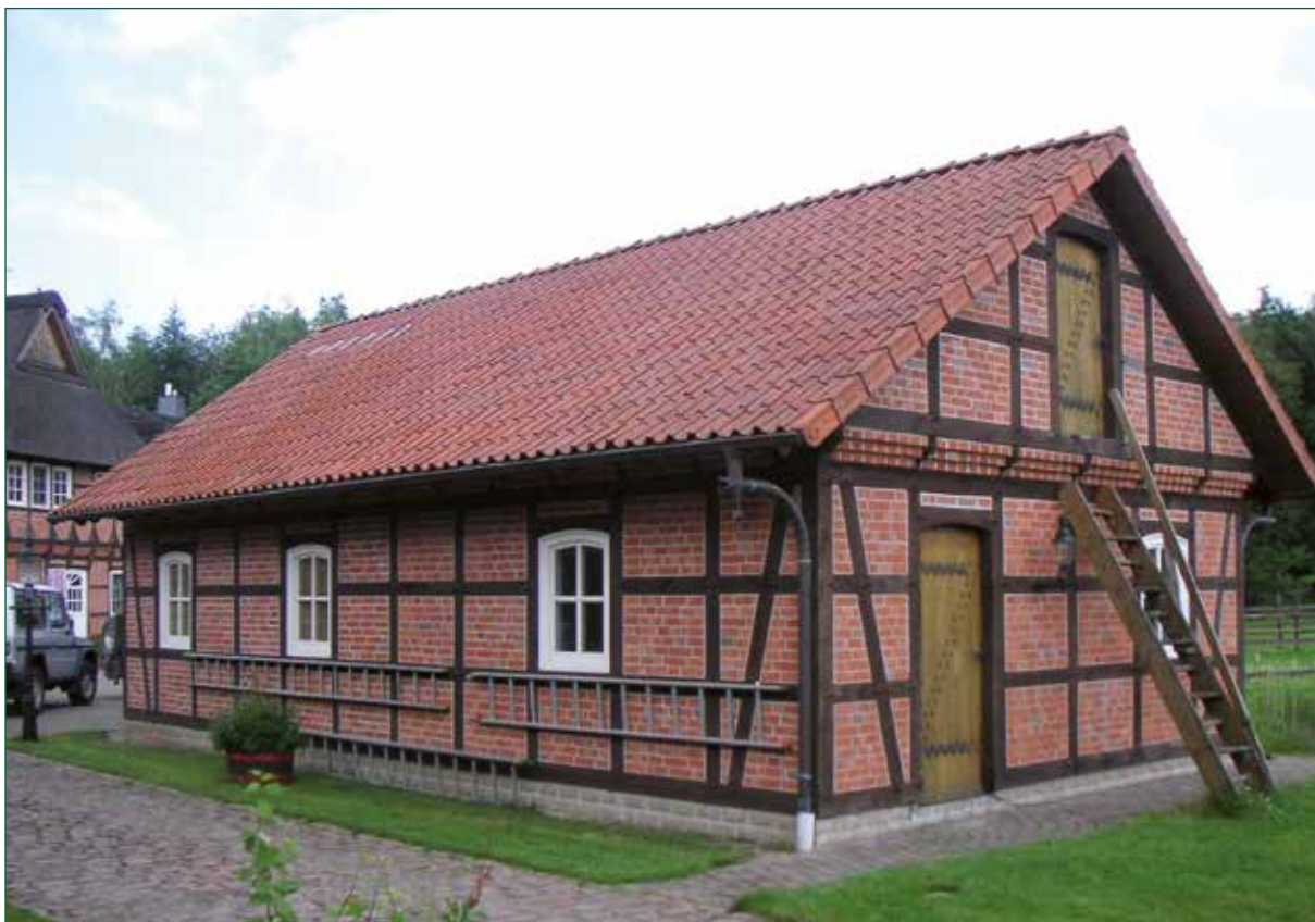
DER SPIEKER-Nebengebäude FW-G4