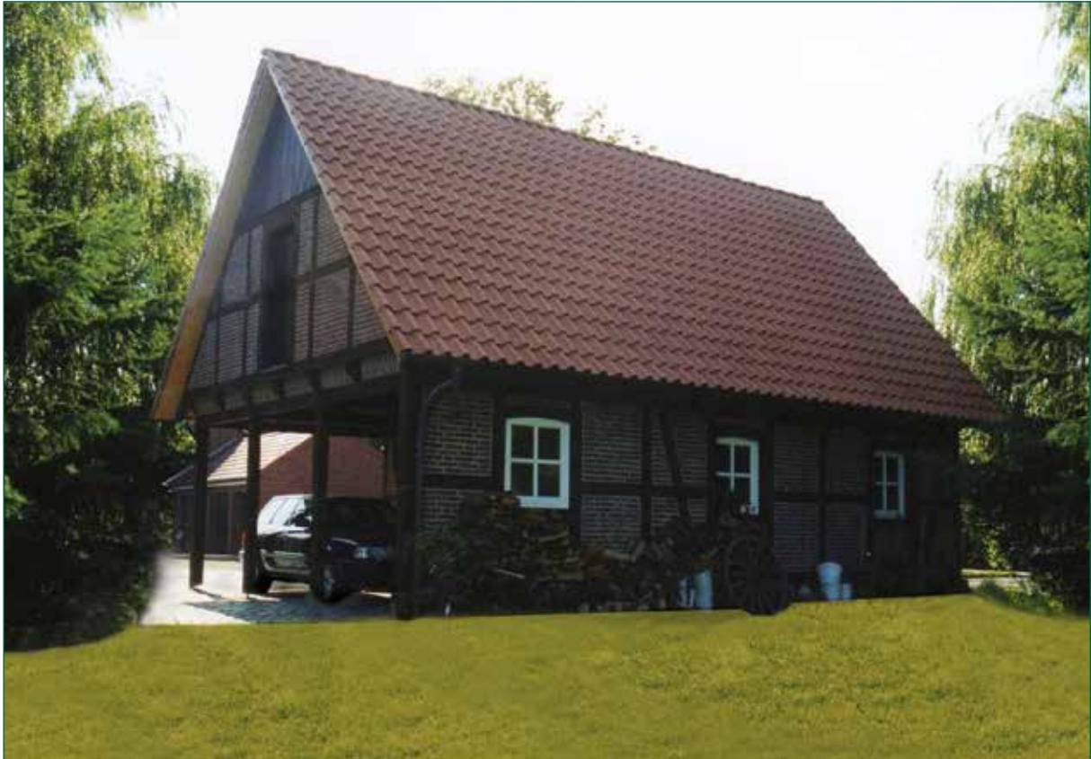
DER SPIEKER-Nebengebäude FW-G3