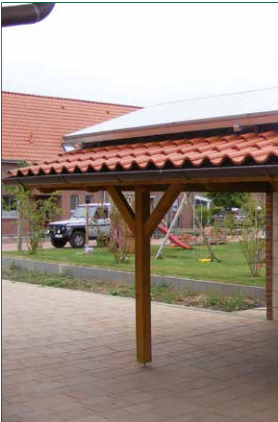
DER SPIEKER-Nebengebäude BS-C1