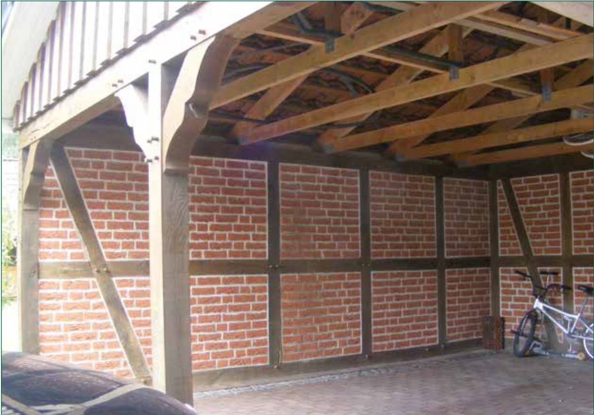
DER SPIEKER-Nebengebäude FW-C2