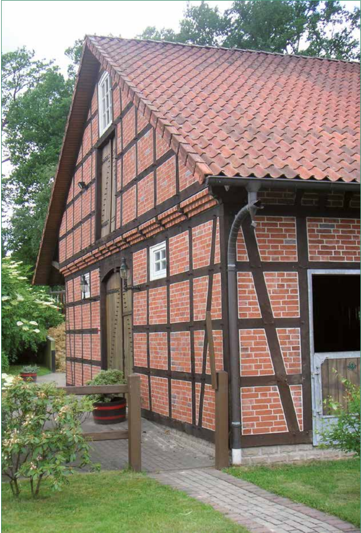
DER SPIEKER-Nebengebäude FW-G10