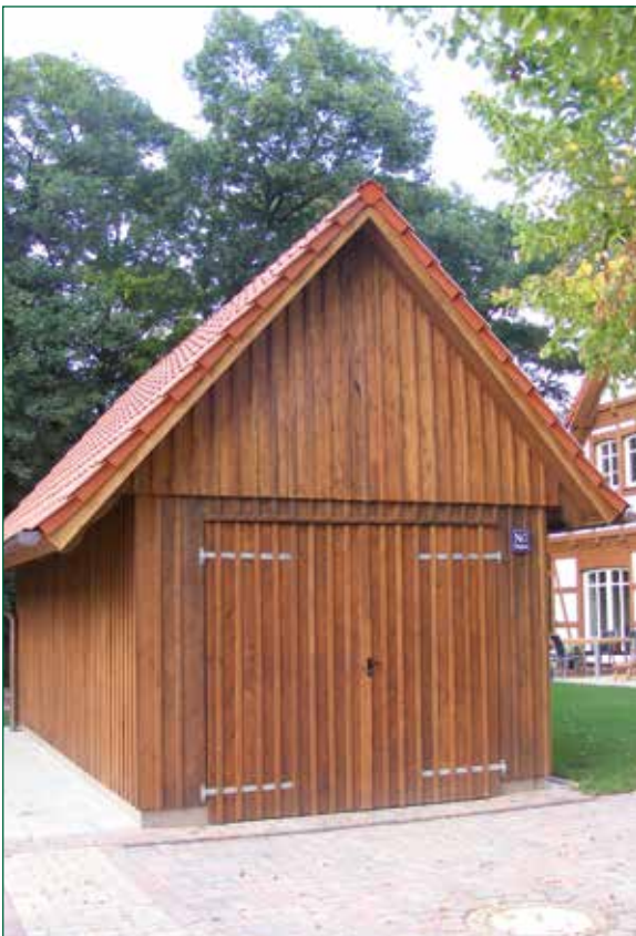
DER SPIEKER-Nebengebäude BDS-G2