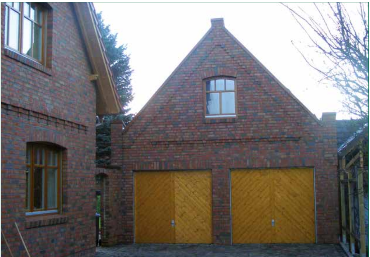
DER SPIEKER-Nebengebäude BS-G4