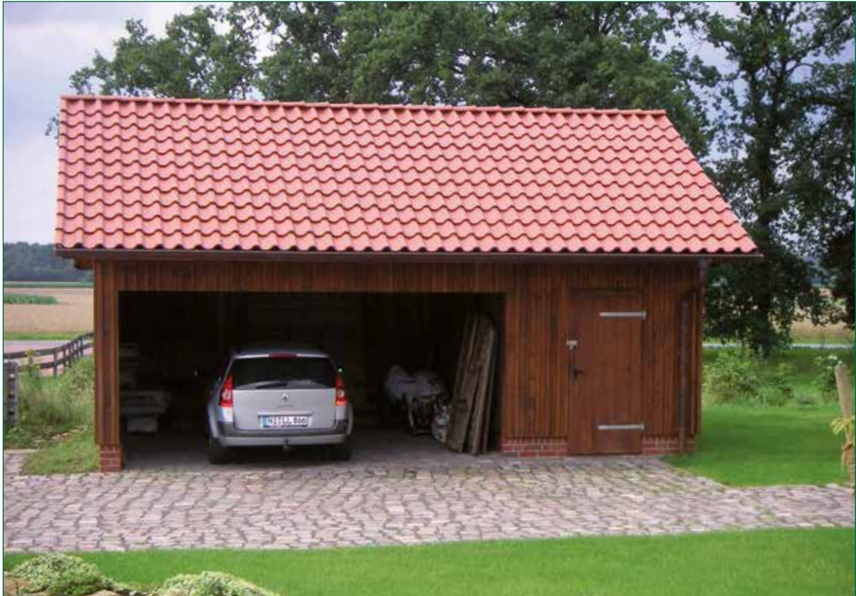
DER SPIEKER-Nebengebäude BDS-C1