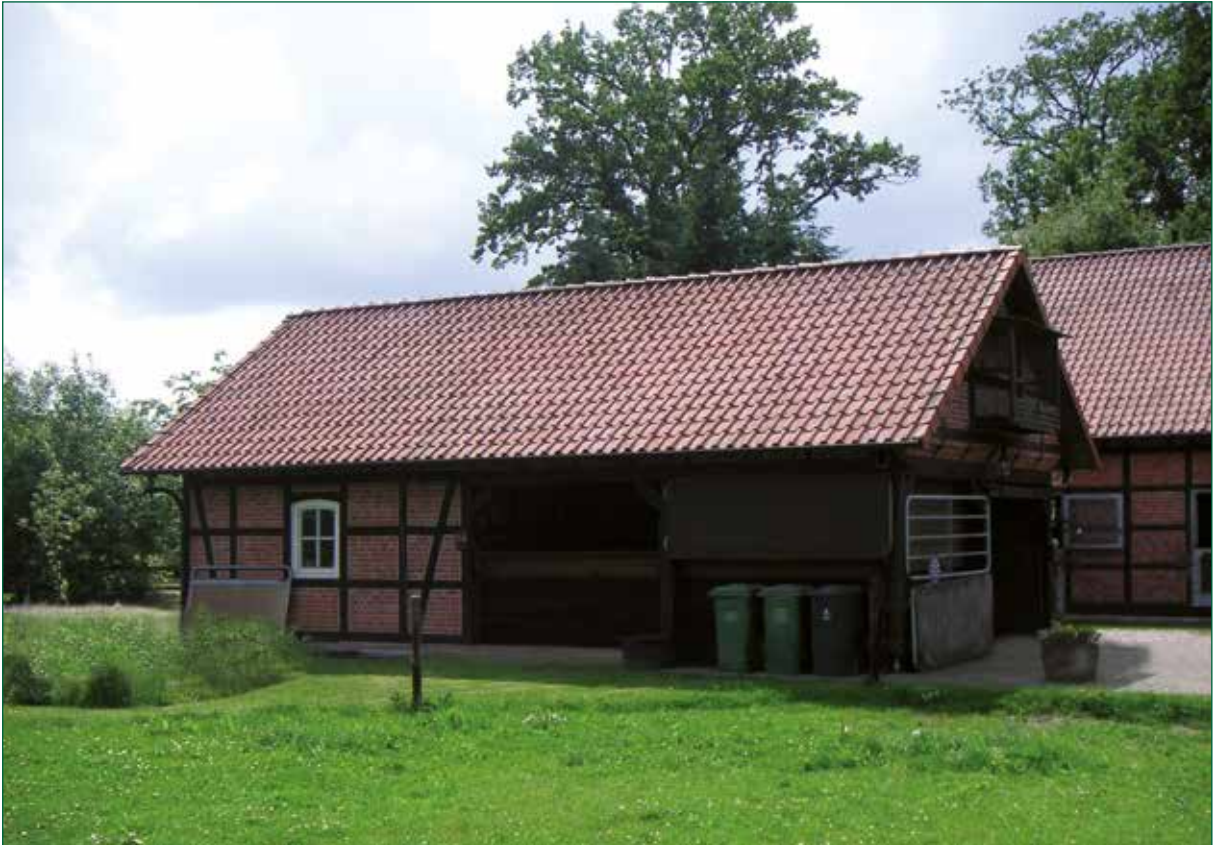
DER SPIEKER-Nebengebäude FW-G4