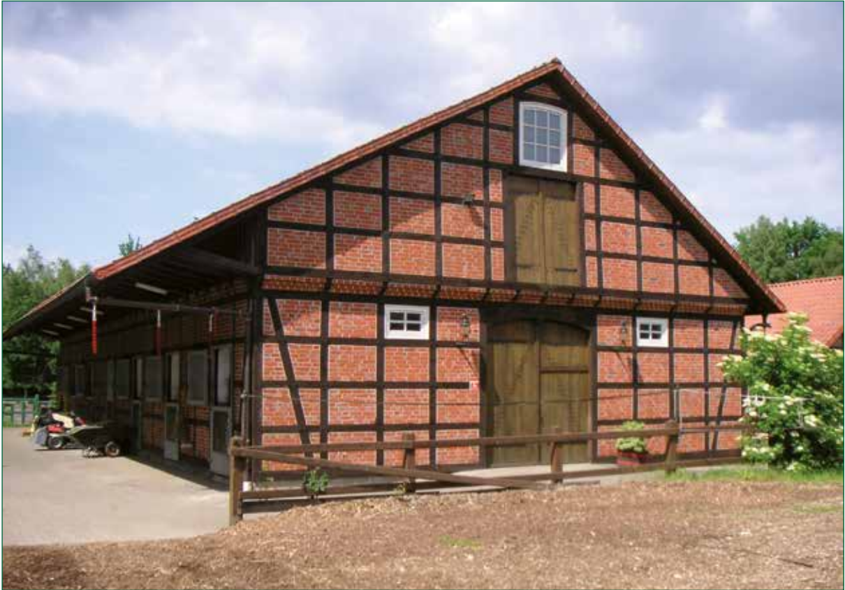
DER SPIEKER-Nebengebäude FW-G10