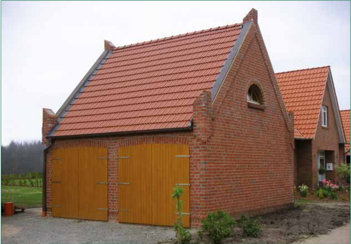
DER SPIEKER-Nebengebäude BS-G3