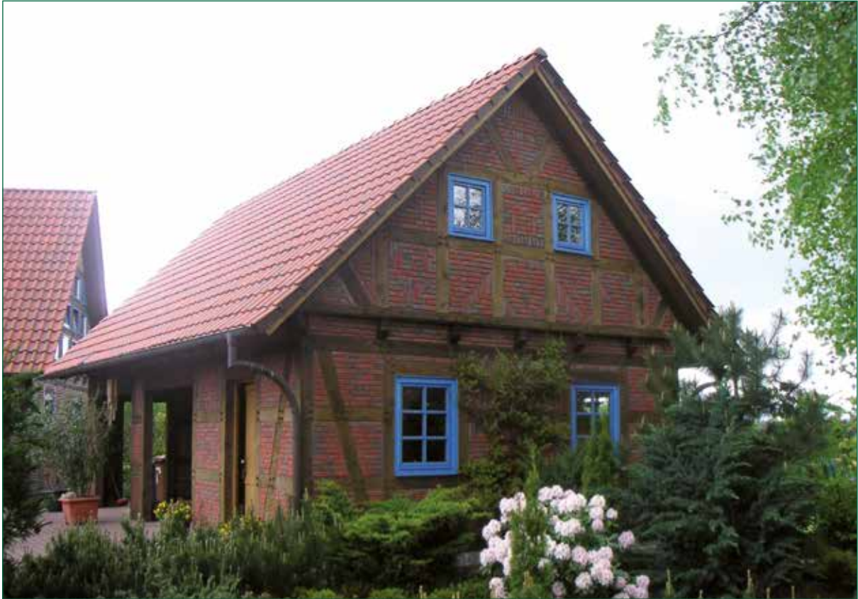
DER SPIEKER-Nebengebäude FW-G6