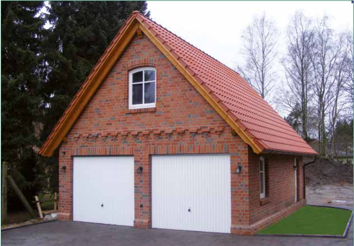
DER SPIEKER-Nebengebäude BS-G5