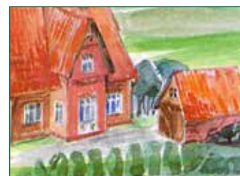
Aquarelle von Nadya Hauswald ( www.nadya-hauswald.de )