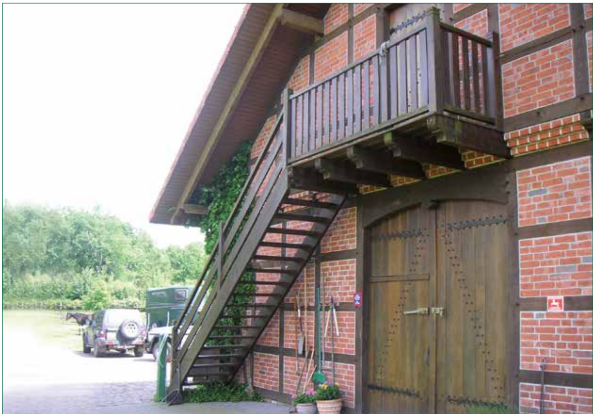
DER SPIEKER-Nebengebäude FW-G10