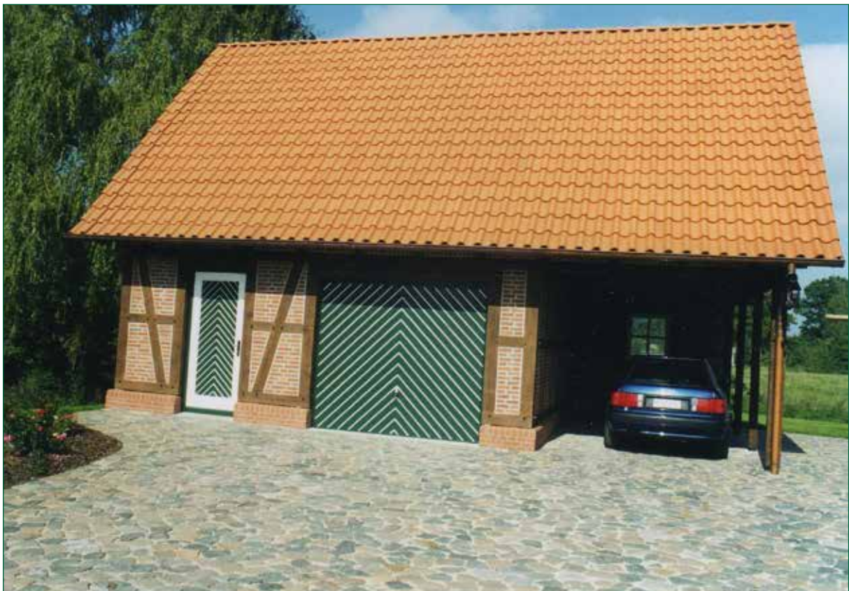
DER SPIEKER-Nebengebäude FW-G3