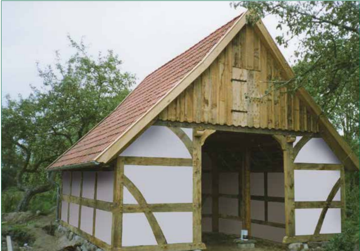
DER SPIEKER-Nebengebäude FW-G2