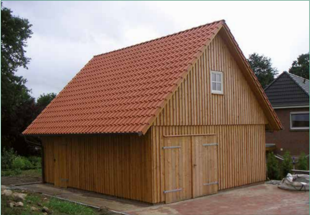
DER SPIEKER-Nebengebäude BDS-G3