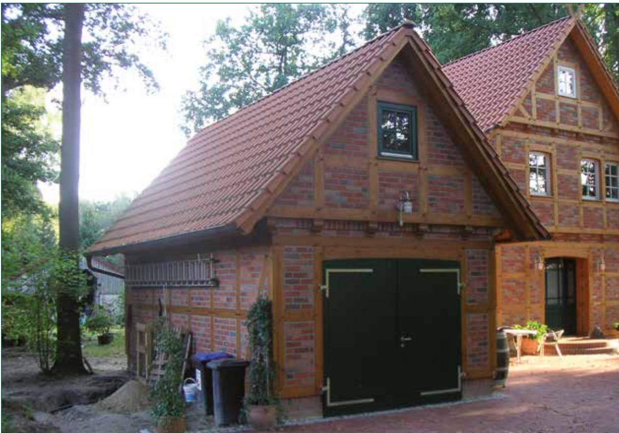
DER SPIEKER-Nebengebäude FW-G1