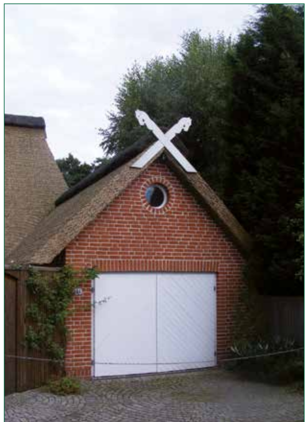
DER SPIEKER-Nebengebäude BS-G1