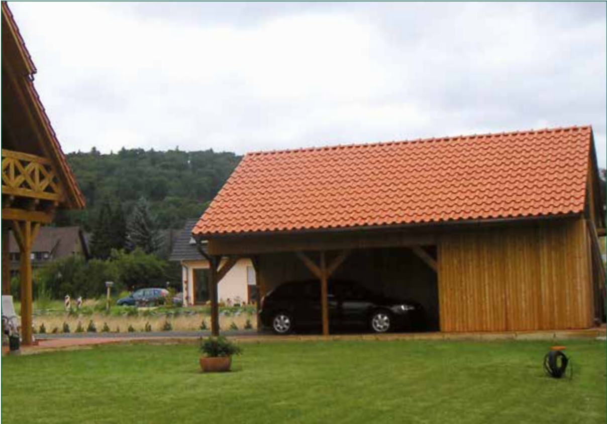
DER SPIEKER-Nebengebäude BDS-C3