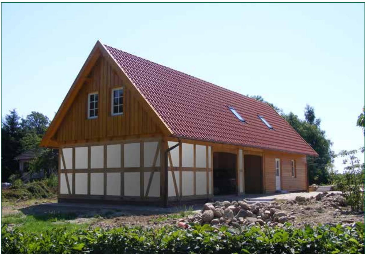
DER SPIEKER-Nebengebäude BDS-G5