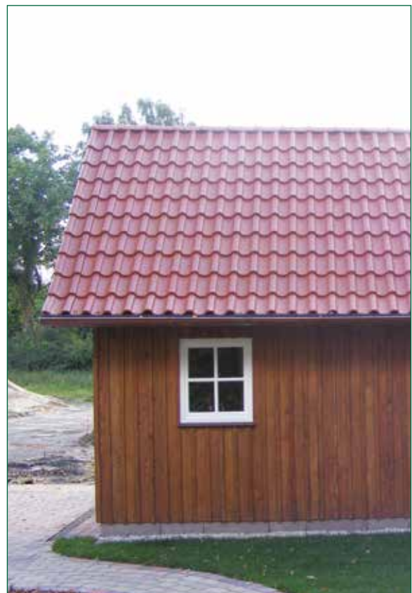
DER SPIEKER-Nebengebäude BDS-G2