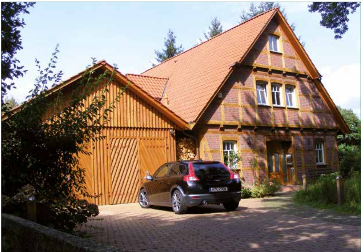
DER SPIEKER-Nebengebäude BDS-G4