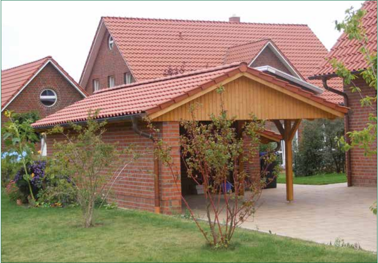
DER SPIEKER-Nebengebäude BS-C1