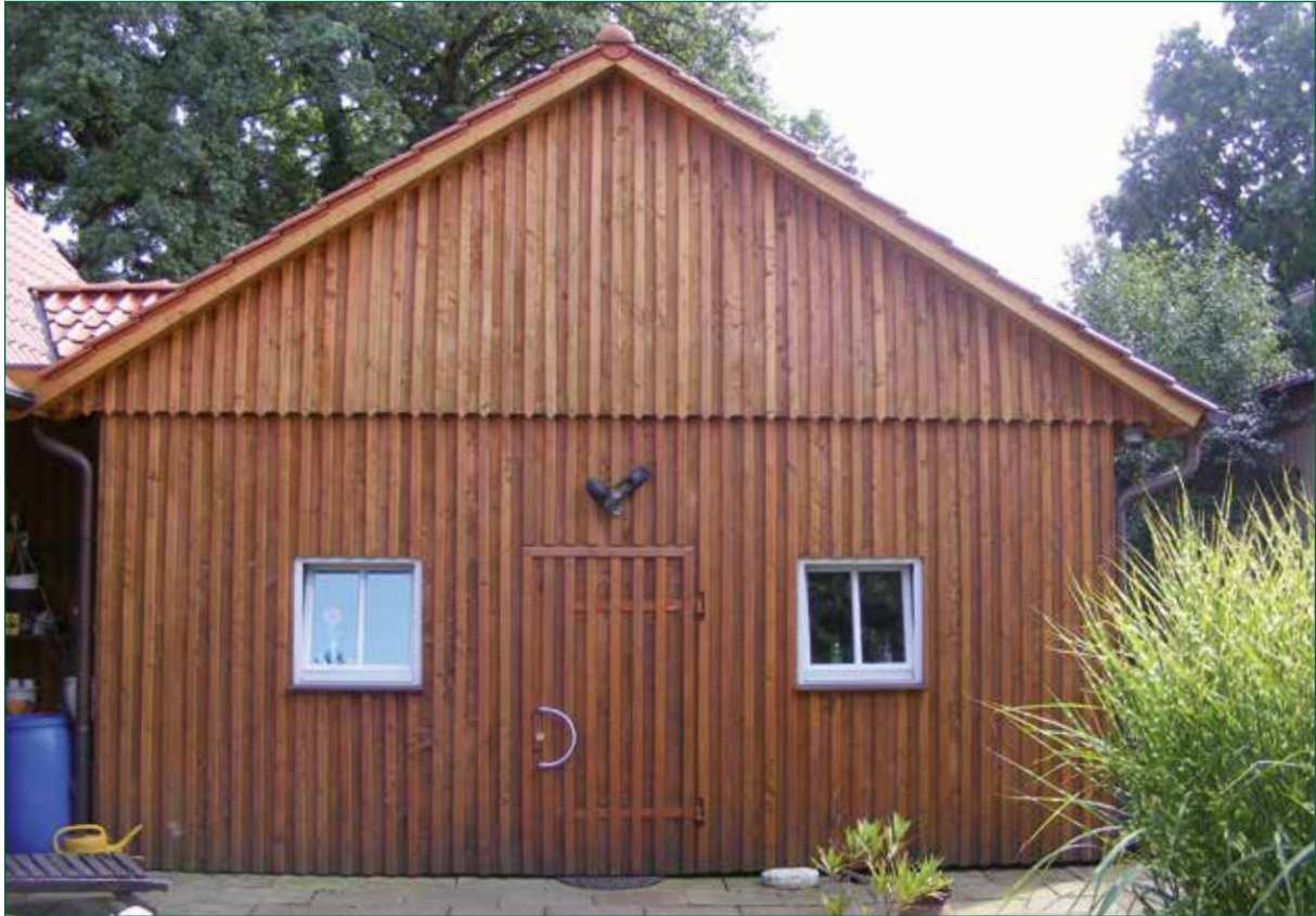
DER SPIEKER-Nebengebäude BDS-G4